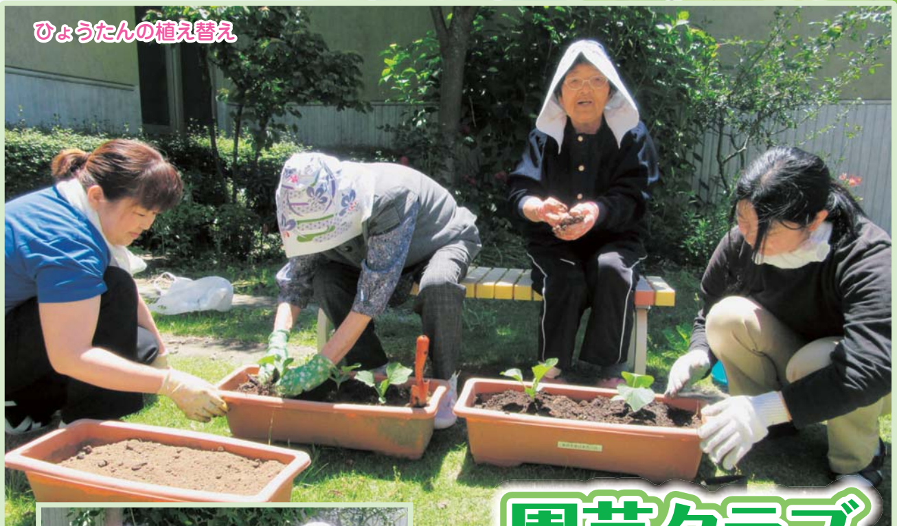
ひょうたんの植え替え

〒975-0033 福島県南相馬市原町区高見町2-70 TEL (0244) 25-2811 FAX (0244) 25-2812 URL http://minamisoma.ask-daiko.co.jp/ MAIL fukjuen@chive.ocn.ne.jp