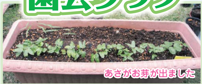
あさがお芽が出ました