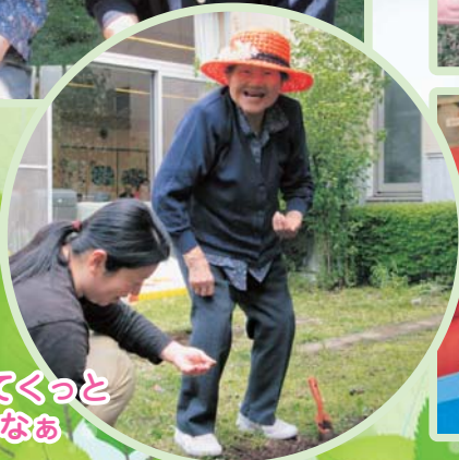
芽え出てくっ いいなあ