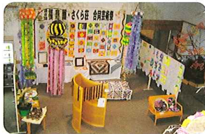
▼色とりどり華やかでした。

七夕飾り以外にも、書道や写真、パッチワークなど、今年も、多くの作品が集まり華やかな芸術祭となりました。