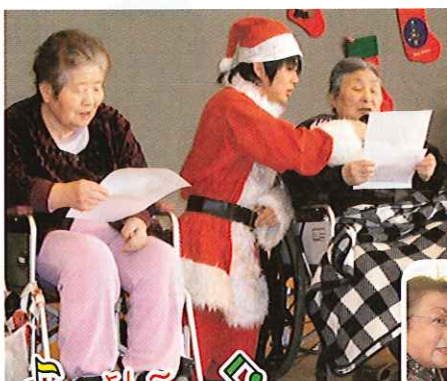
ご家族との食事の様子

お昼は、ご家族の方々と一緒においしい料理を食べながら、会話も弾み、外の寒さを感じさせない温かいクリスマス会となりました。