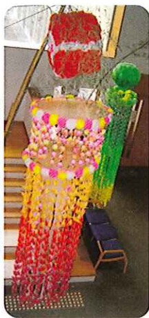
▶見事な七夕飾りの完成です!

今年の合同作品は、福寿園とさくら荘の利用者の皆さんと職員も参加して、「七夕飾り」を作りました。