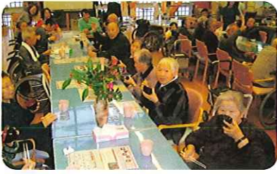
▲とってもおいしいです。

おもち、お汁粉として食べましたが、「おかわり!」の声が聞かれるほどのおいしさでした。