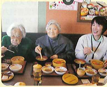
▲おなかいっぱい食べました。

紅葉の鮮やかな赤や渓谷を流れるせせらぎは、絶景でした。おいしい空気をすった後は、「まるまつ」での昼食です。各自好きな物を注文し、おなかいっぱい食べました。皆さん、身も心も大満足のドライブとなったようです。