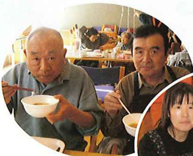
ご家族との食事の様子

自分達で作ったおいしい料理を食べながら、ご家族との会話も弾んでいるように感じられました。