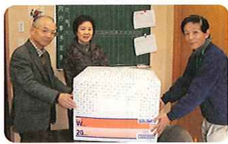
▲大蘆地区福祉委員会の方々がありがとうございました