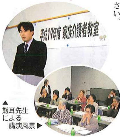
▲熊耳先生による講演風景▶

参加された方々からは、「予防の為にも口腔ケアがとても大事ということが分かった」との感想も聞かれました。来年度も家族介護者教室の開催を予定していますので、ぜひ皆様ご参加下さい。