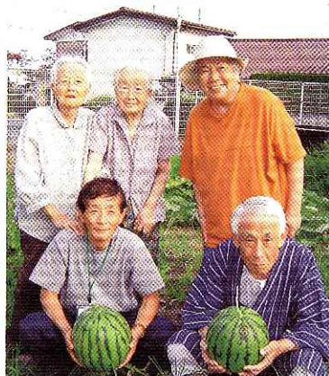
▲おいしいスイカだよ♪

5月の終わりに中庭の畑に植えたスイカの苗は、天候に恵まれ、あっという間に大きくなりました。スイカの成長を支えたのは、何ととっても皆さんの熱い視線です。居室のベランダから、「甘くなれ」「大きくなれ」と応援してくれたおかげで、とっても甘くてみずみずしいスイカが収穫できました。大地の恵みに感謝しながら、夕食の時に皆でおいしくいただきました。早くも来年に向けて楽しみにしている方もいらっしゃいました。