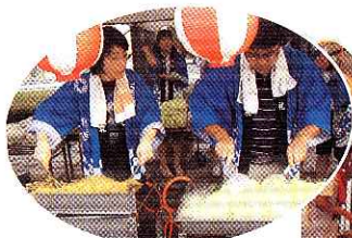
▲ヤキソバも人気でした

8月5日(日)に夏祭りが開催されました。今年も良い天気にも恵まれ、利用者の皆さん、ご家族、地域の方々など多くの来場者を迎えることができました。