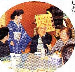
◀ひばり会の皆さんとの交流の様子