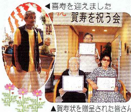
喜寿を迎えました 賀寿を祝う会

10月22日から、福寿園・さくら荘合同芸術祭を開催します。作品は手作りであれば何でも結構ですので、出展希望の方は受付期間内に福寿園までお持ち下さい。皆様の力作をお待ちしております。 【作品受付期間】 平成19年10月8日(月)～平成19年10月19日(金)