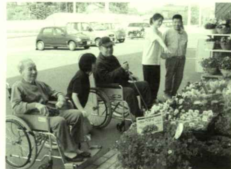
どれにしようかな?

5月の第2週と第4週の2週を使 って買い物ツアーを行いました。買 い物に向かった先は、ダイユー エイト高平店です。福寿園から車 で5分程度の距離にあるため、移 動時間が短く、そのおかげで商 品を選ぶ時間を多くとることが できました。