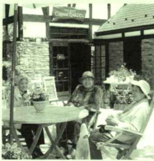
大森プランツでの風景

4月、相馬市の馬陵公園へ花見に出かけました。今年は、例年より開花が早いと言われていましたが、桜はまだつぼみで、日当たりの良い場所がようやく3分咲きといったところでした。ちょうど散歩に来ていた保育園児達と記念写真を撮ることができ、良い思い出となりました。5月には、小高区の大森プランツへ出かけました。天気も良く、山々の木も若葉が茂り、きれいな花々を観ながらのアイスクリームは、格別でした。