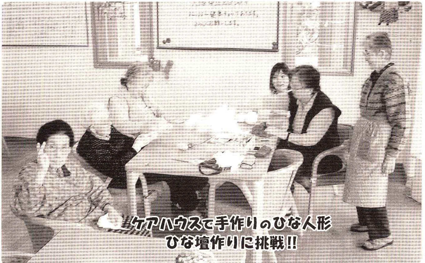
ケアハウスで手作りのひな人形 ひな壇作りに挑戦!!