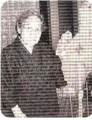
福寿園ヘルパーの歴史を知る*花!

毎年、大きく綺麗な姿を楽しませてくれるその花は、この方と私たちのお付き合いが始まった同時期に、贈られたものだそうです。愛情をたっぷり注がれて咲いているその姿は、誇らげに輝いています。私たちヘルパーもこの花のように利用者の皆様から愛され、いつまでも輝いていたいなと思つた春の一日でした。