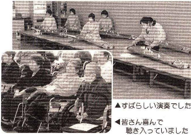
▲すばらしい演奏でした ◀皆さん喜んで聴き入っていました

これから春本番を迎え、皆さんお花見ドライブや、お散歩などの様々な行事をとて楽しんでみられています。