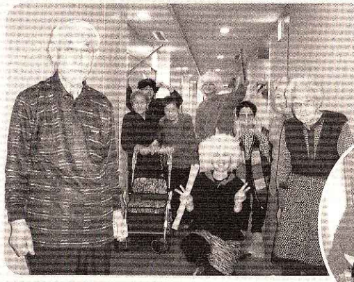
▲豆まきが終ってハッピー♀