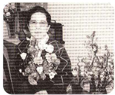
季節感を大切に考えています。現在【スイセン】を作成中です。