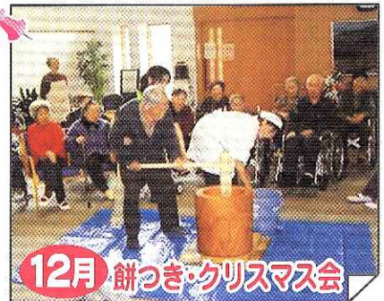
12月 餅つき・クリスマス会

12/12～12/25、あんこ餅とお雑煮にしました。また、全員にクリスマスプレゼント！