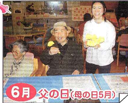
6月 父の日(母の日5月)