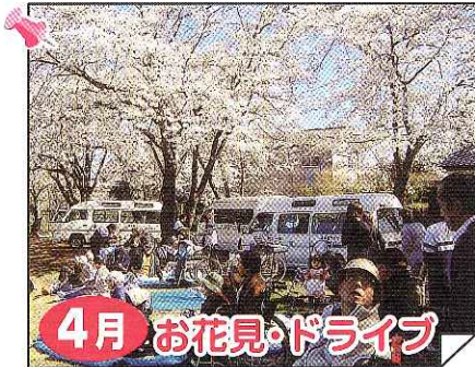
4月 お花見・ドライブ