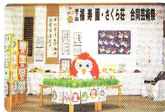
▲デイサービス作品

第7回合同芸術祭が行われました。利用者の方々は、出来上がりを楽しみに制作に取り掛かっていました。利用者ご家族からも、日頃作られている多数の作品が出品されていました。