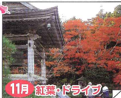
11月 紅葉・ドライブ