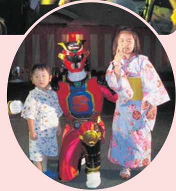
▲ディネードと一緒に