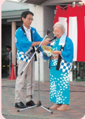
▲利用者代表あいさつ

来年も今年以上に楽しい納涼祭を開催し、利用者の皆さんに楽しんで頂けるよう職員一同努めて参りたいと思いますので、これからもよろしくお願いたします。大勢の方々のご協力、本当にありがとうございました。