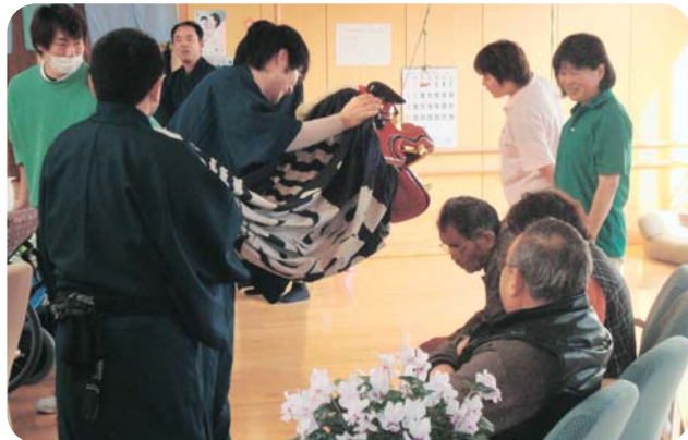
神楽「ご利益があるといいですね」