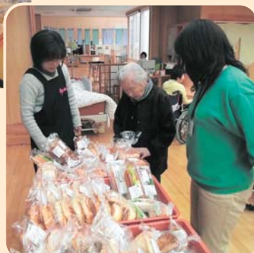
お気に入りのパンは残ってるかなあ？

万葉園では、2月から毎週金 曜日にパン屋さんに来ていただ いてパン販売を始めました。最 初は大食堂で利用者の皆さんを お待ちするという形でしたが、 今は移動販売のように各エリア をまわっています。種類が豊富 なので、どれにしようか迷いな がらも自分の好きなパンを皆さ ん買っているようです。毎週金 曜日が楽しみですね!