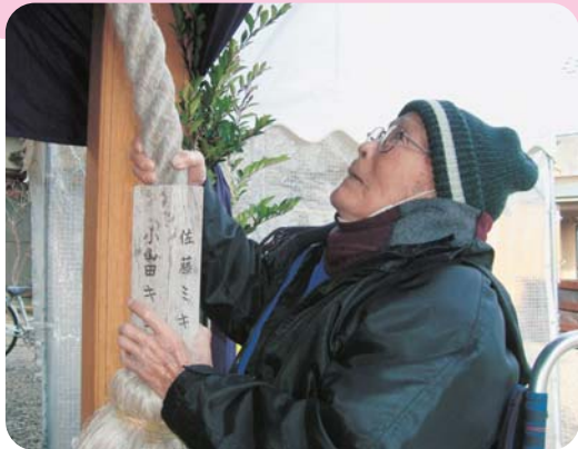
初詣「今年は鹿島御子神社に行ってきました」