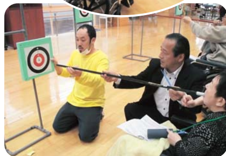
皆で協力してチャレンジ!!