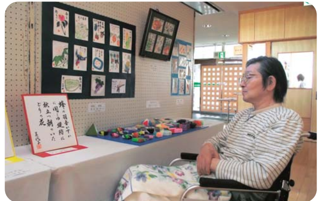
芸術祭「今年も皆さんの力作をお待ちしています」