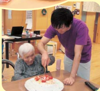
上手に 切れるかな?~