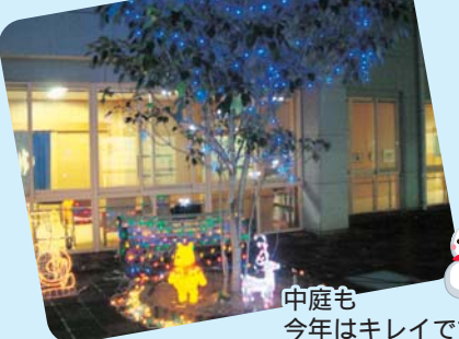
中庭も 今年はキレイです。