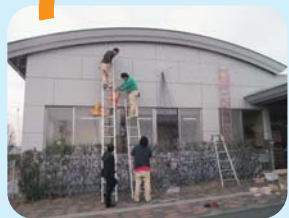
バランスを確認しながら 飾りつけます。