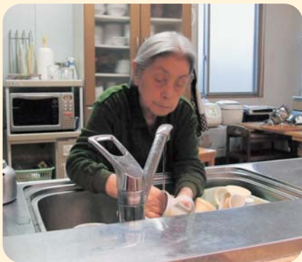
みなさんの日常の様子です。