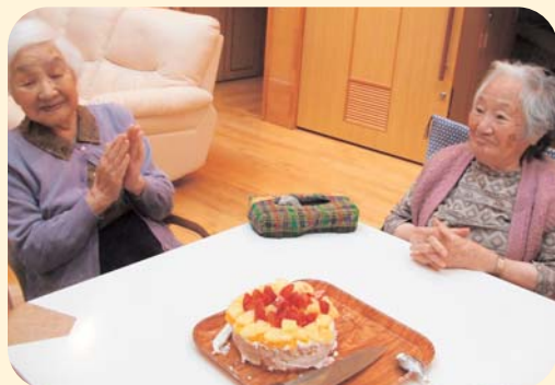
▲たっぷりフルーツの手作りケーキで誕生日のお祝い

を多く持ちました。特に調理の 場面では、利用者の皆さんの知 恵や技術をお借りすることが多く、 楽しみながら率先して行われる 姿が多く見られました。また暖 かい季節になり、インフルエン ザの流行が治まった後は、地域 交流を多く持ち、活動的な生活 を送っていただきたいと思います。 お知らせですが、12月末にス プリングラーの設置が完了いた しました。今後も利用者の皆さんに 安全で安心な生活が提供でき るよう努めてまいります。 皆様にとっても幸多き一年に なりますように、お祈り申し上 げます。