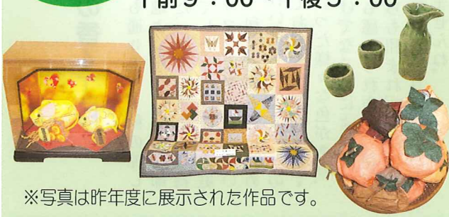
※写真は昨年度に展示された作品です。