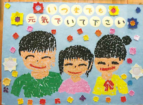
原町第三小学校の皆さんから