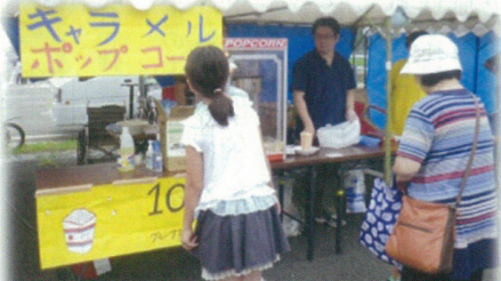
キャラメルポップコーン模擬店参加

11時から20時までのイベントを見学したり模擬店でおいしいものを買って食べたり、盆踊りに参加したりとそれぞれの利用者のご家族や地域の方たちと楽しめました。