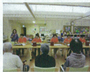
(琴名流大正琴ひまわり会)様