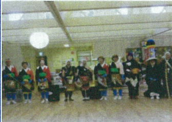
(高平宝会「奉載踊り」)様