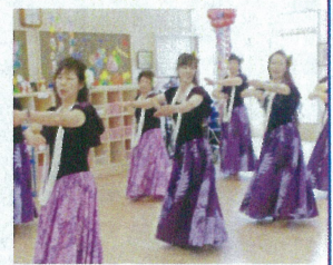
(プラ・プアナニ)様