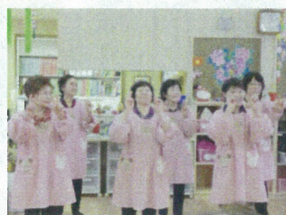
(石神福祉委員会)様